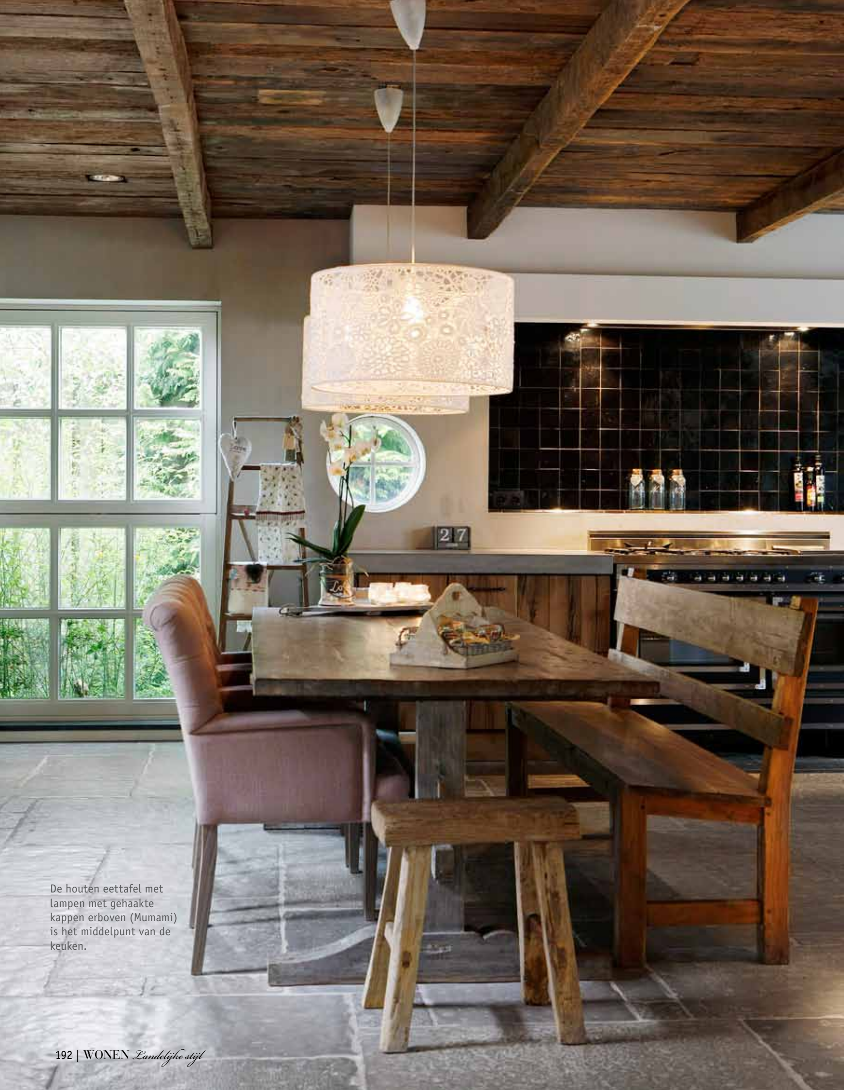
De houten eettafel met lampen met gehaakte kappen erboven (Mumami) is het middelpunt van de keuken.